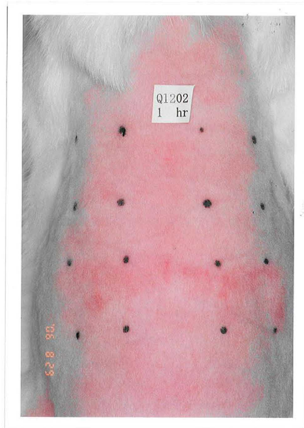
除去 1 時間後 (No.202)

注射用水 (健常) 左上 右上 注射用水 (損傷) GD-1 (損傷) 左下 右下 GD-1 (健常)